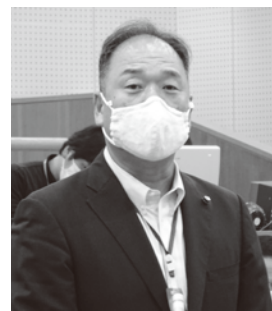
たくさんの方から善意のマスクが届けられました。

コロナ感染症の拡大で、すでに丸亀市内で400人を超える方が新しく生活福祉資金の貸し付けを受けています。家賃が払えない人のための住宅確保給付金も多くの方が利用中です。