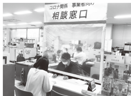
相談窓口をご利用ください。